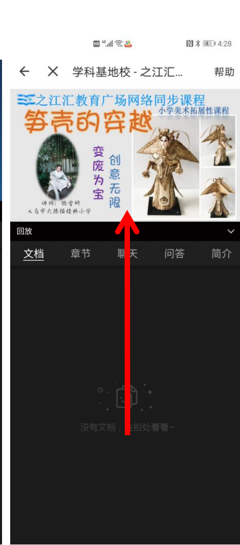
6.开始播放得1分 一天看三次就得3分